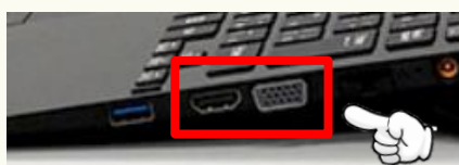
端子はノートパソコンの側面にあります。