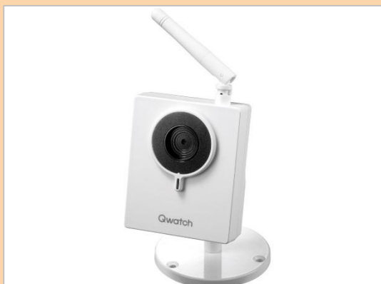
130万画素に対応した スタンダードモデル