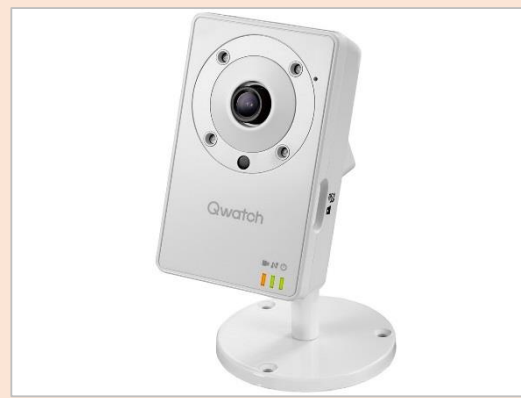
双方向で会話OK! マイク・スピーカー搭載モデル